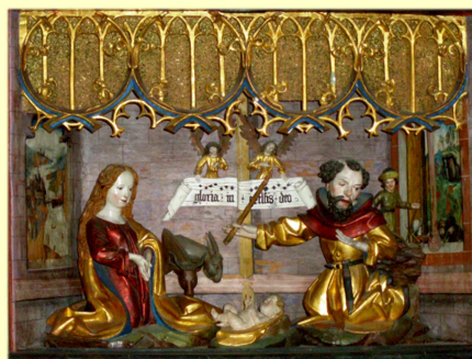
Spätgotischer Flügelaltar 1480 (Detail) St. Magdalenen-Kapelle Hall/Tirol