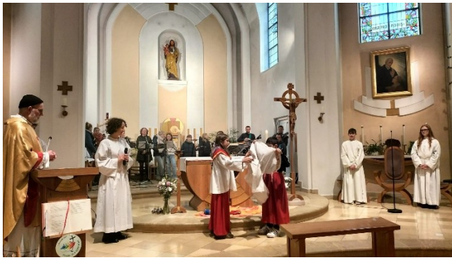
Einkleidung des neuen Ministranten in St. Josef

Am Christkönigsonntag feierten wir die Einkleidung unseres neuen Ministranten